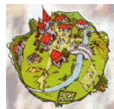
Foyers ruraux PACA