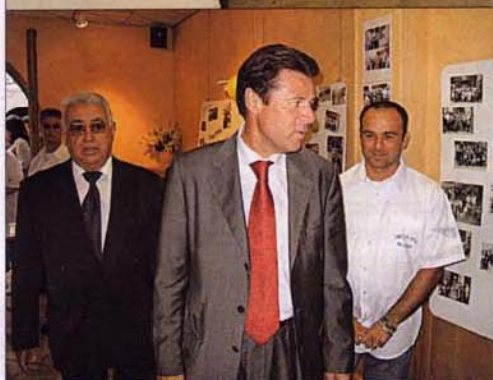
Le ministre visite l'exposition rétrospective