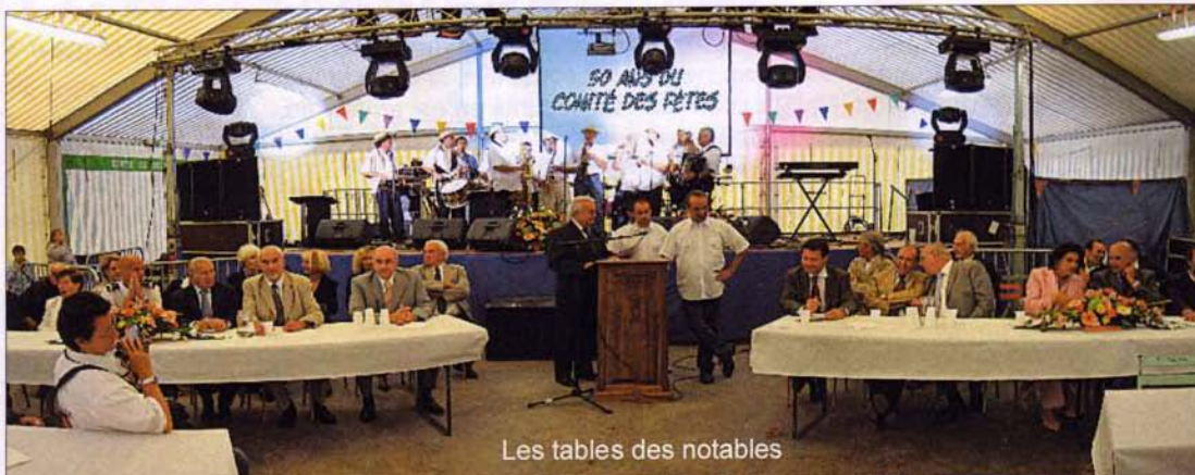
Les tables des notables