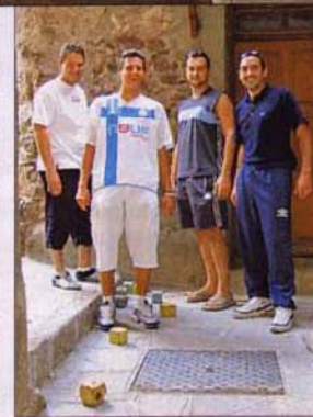
Et les boules carrées !!!