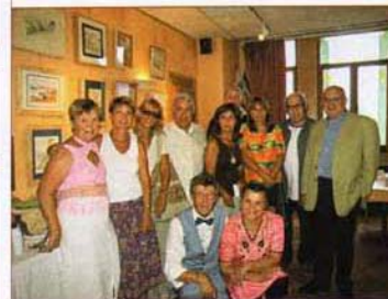
Les artistes peintres lors du vernissage