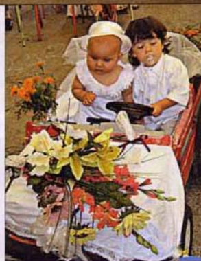
Bal masqué des enfants