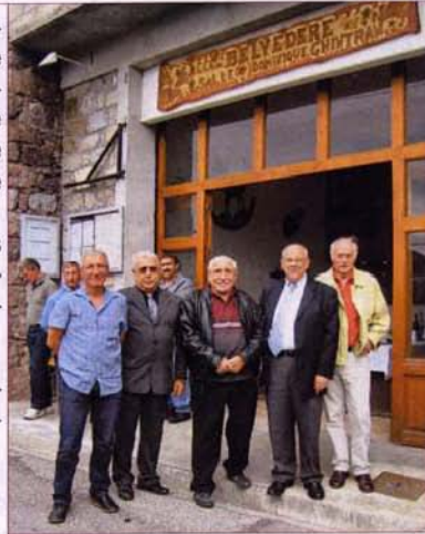
Salle Dominique Ghintran