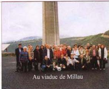
Au viaduc de Millau