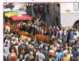
Fête du Rosaire