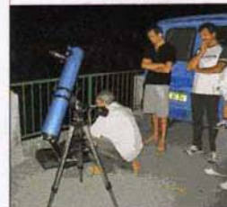
La nuit des étoiles