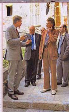
Lors de la visite du sous préfet

Dans la foulée, la rue des herbes a eu droit au même traitement.