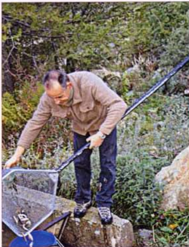
Alevinage dans la Gordolasque

Très tôt, le matin, des membres des sociétés de pêche de Belvédère et de Roquebillière ont procédé au vidage du lac Saint-Grat qui avait été ensemencé au printemps, de ses alevins.